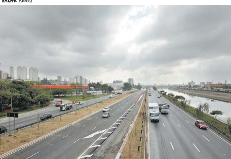
DOIS MOMENTOS - Trecho da Nova Marginal, no sentido Castelo Branco, recém-inaugurado, pouco depois das 9h e às 10h15 de ontem