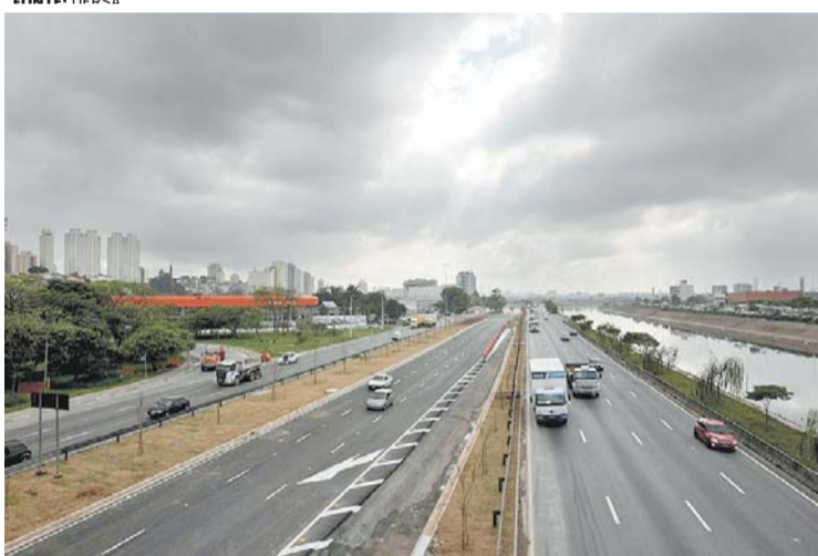
DOIS MOMENTOS - Trecho da Nova Marginal, no sentido Castelo Branco, recém-inaugurado, pouco depois das 9h e às 10h15 de ontem